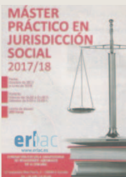
La información está disponible en la Fundación de Relaciones Laborales.

adecuadamente su actividad además de desarrollar habilidades como el trabajo colaborativo, la toma de decisiones, el liderazgo, la creatividad y la comunicación y la capacidad de negociación.