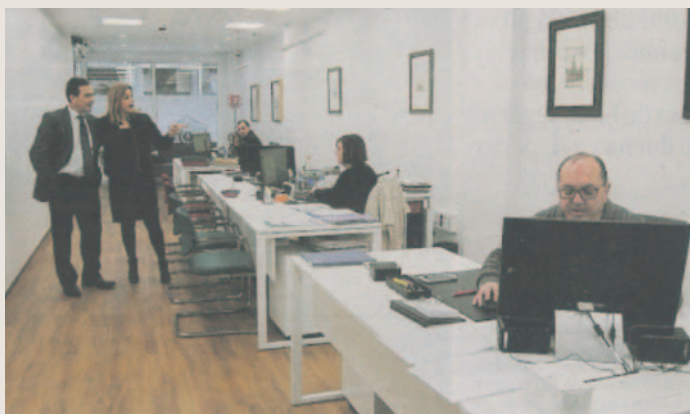
Nueva sede del Colegio de Graduados Sociales en la calle Monforte.

Desde el Colegio apuntan que es tremendamente importante que los egresados se colegien al salir de las facultades, ya que es la siguiente puerta y el paso previo para acceder a la profesión y completar y especializar su formación. Esta nueva sede cuenta con 195 metros cuadrados de superficie y facilita a sus usuarios una accesibilidad universal. Un cambio significativo teniendo en cuenta que han pasado de una entreplanta con escaleras en donde se encontraba situada la antigua sede del Colegio,